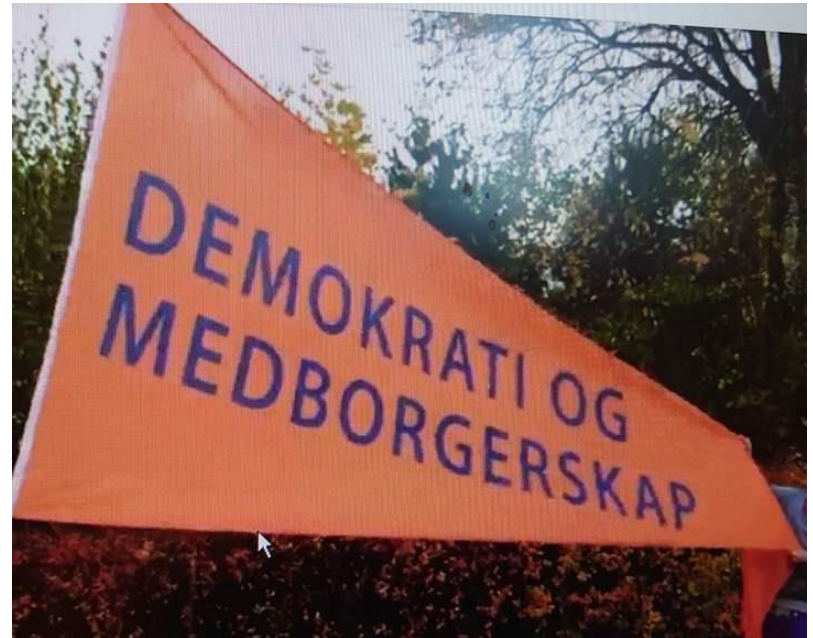
Fra Lysejordet skole